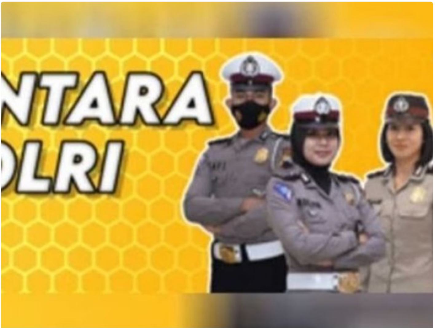
Penerimaan Polri Bakomsus

PALANGKA RAYA - Kesempatan terbuka bagi lulusan bidang pertanian, perikanan, peternakan, gizi, dan kesehatan masyarakat untuk bergabung menjadi anggota Polri melalui program penerimaan Bintara Kompetensi Khusus (Bakomsus).